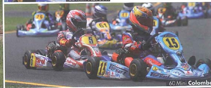
60 Mini Colombo