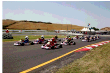
La partenza della Formula 60 ACI-CSAI

Siena - Il terzo round del Campionato Italiano Karting promosso da ACI Sport ha confermato il potenziale delle scelte organizzative e promozionali intraprese dalla ASN Italiana (CSAI), tanto che ben 188 piloti si sono sfidati sul circuito di Siena nelle classi 60 MINI, KF3, KF2, KZ2 e nella nuova Formula 60 ACI-CSAI; proprio quest'ultima categoria promozionale, che vede i piloti da 8 a 10 anni confrontarsi in pista con mezzi identici forniti da Birel, prosegue a riscuotere consensi da parte degli addetti ai lavori, coniugando costi molto bassi di partecipazione, con elevate caratteristiche formative.