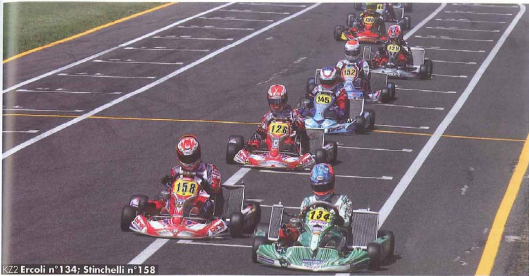
KZ2 Ercoli n° 134; Stinchelli n° 158