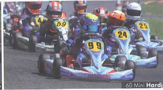
60 Mini Hardia