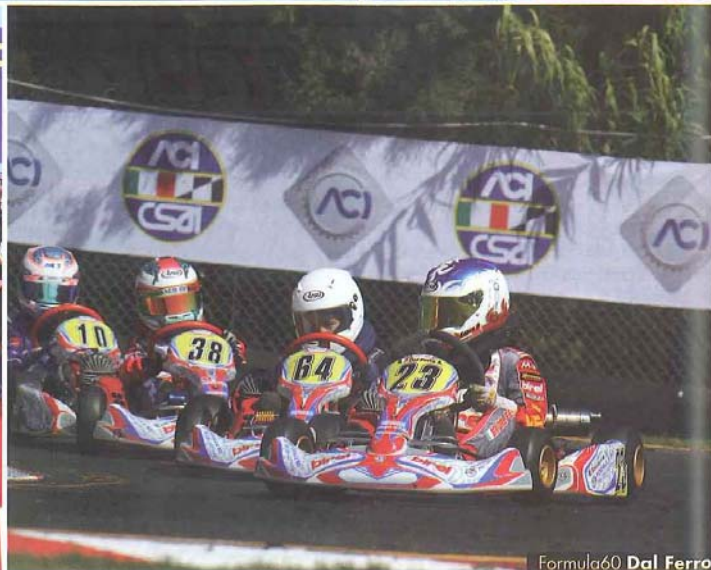
Formula60 Dal Ferro