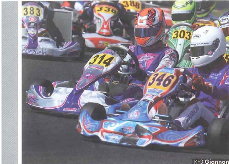
KF3 Giannoni KF3 Lorandi A.